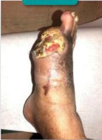
深部潰瘍合併 膿瘍或骨髓炎。