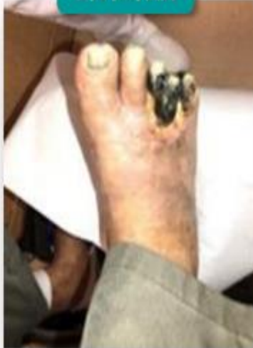
前足部部分壞疽 (局部壞疽)。