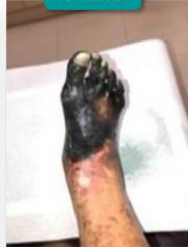
整個足部廣泛壞疽 (全足缺血性壞疽)。