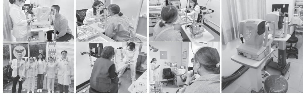
國軍花蓮總醫院關心您的健康

本院富世門診中心位處於秀林鄉富世村內，鄰近著名太魯閣中橫牌坊，服務範圍包括中部橫貫公路沿線居民，鄰近的富世村、新城村、秀林村、崇德村等當地村民，以及富世國小、崇德國小、秀林國中學校學童，屬當地最大的社區醫療中心 本院考量偏鄉地區居民就醫便利性，特別規劃開設眼科門診服務，減少病患來回市區就診之辛勞，亦可致力於提升當地民眾就醫的品質與可近性 另一方面，眼科開設除針對當地老年性眼疾病患的診療之外，對於糖尿病患的視網膜追蹤檢查，以及學童常見的近視等問題，均能夠提供更即時的諮詢與協助 本院自114年11月18日起每隔週二(11/18、12/02、12/16、12/30)上午開設眼科門診，歡迎有需求的鄉親可先行預約掛號，歡迎官兵眷屬及地區鄉親諮詢診療 •人工電話預約掛號：(03)861-0918 •網路預約掛號網址：https://reg.805.mnd.gov.tw/ •本院富世門診住址：花蓮縣秀林鄉富世村101號